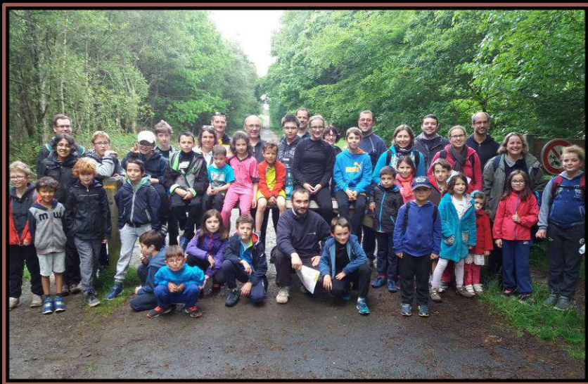
Les 9 équipes au CRAPA