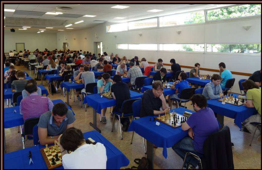
Rapide de Liffré