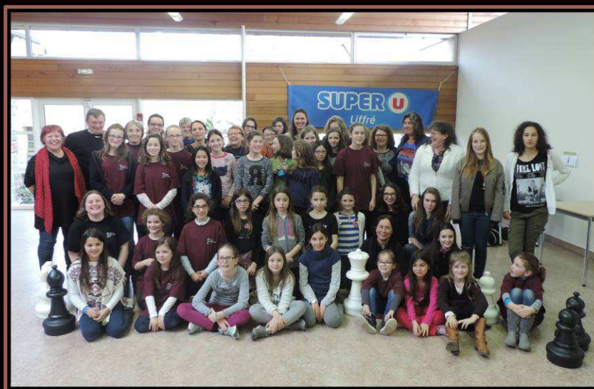
Bretagne Rapide Féminin 06/03/2016