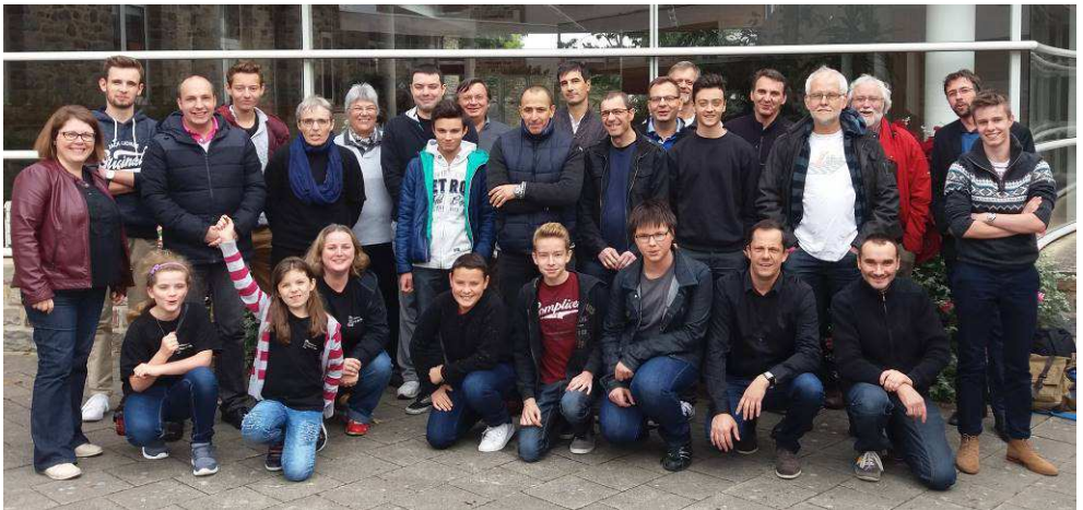
Les équipes adultes 2016 – 2017, 30 joueurs

Pour toute question : liffre@echecs35.fr