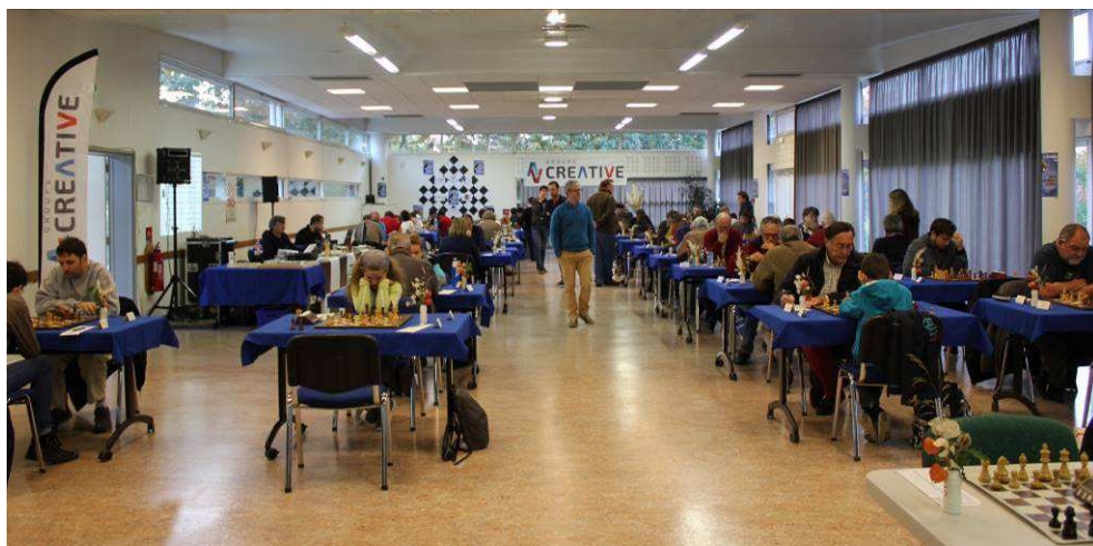
Open international de Liffré, édition 2016