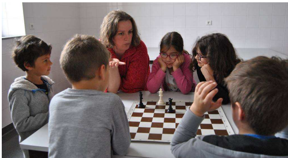
Le cours des Petits pions